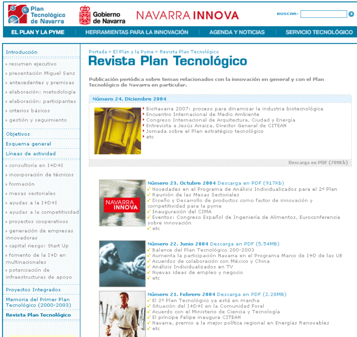
Imagen 4 – Archivo en pdf de la Revista del Plan Tecnológico (detalle)

En esta sección del 2º Plan Tecnológico se ofrece también un resumen-memoria de lo que ha sido el Primer Plan Tecnológico (2000-2003), así como un archivo en pdf de todas las revistas del Plan Tecnológico que se han publicado hasta ahora. Ver imagen 4.