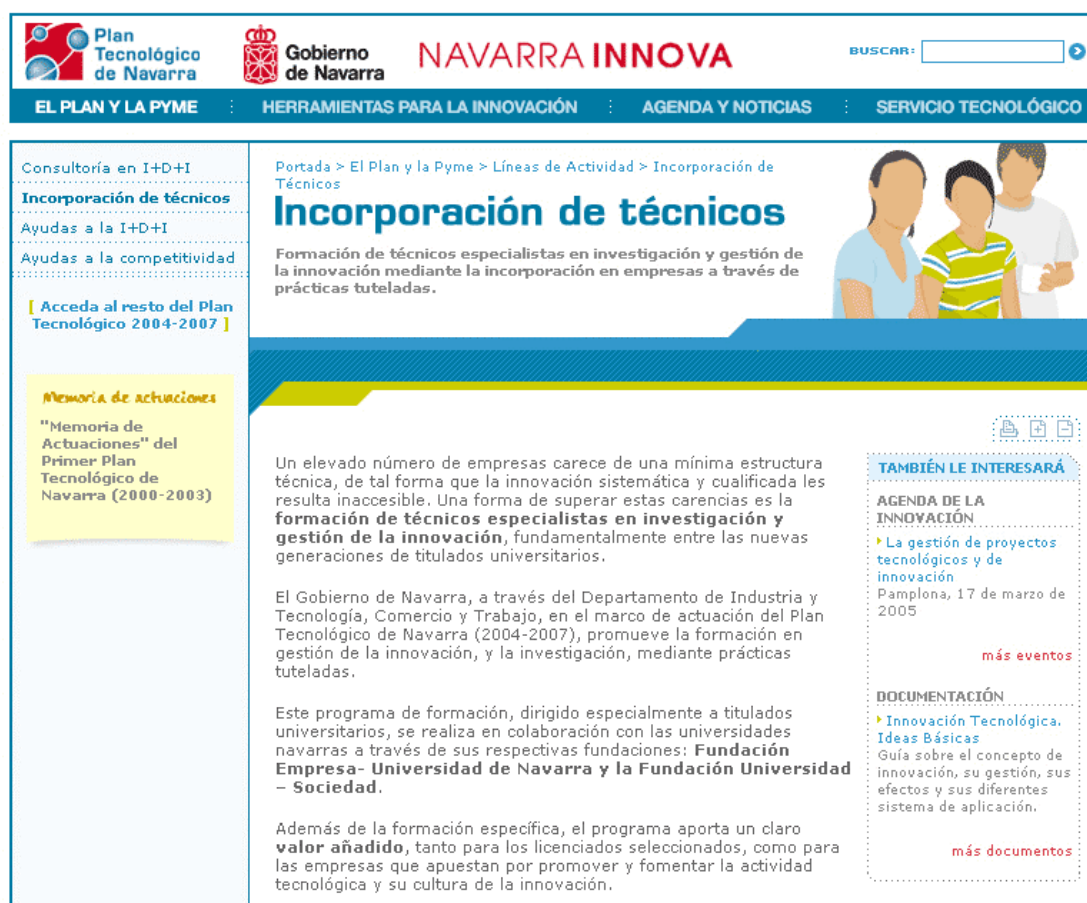
Imagen 2 – Línea de actividad Incorporación de técnicos (detalle)

Por otro lado, y siempre buscando un mayor beneficio para el usuario, se relacionan de manera permanente a lo largo de toda la web contenidos de diferentes secciones que pueden ser de interés para el usuario. Esto ocurre, por ejemplo, de manera permanente en las diferentes Líneas de Actividad del Plan Tecnológico, ya que al usuario se le ofrece información de valor añadido ( También le interesará ) que se encuentre en otra sección y que tenga relación con esa línea de actividad en concreto (un documento, un curso, una noticia,...). Ver imagen 2.