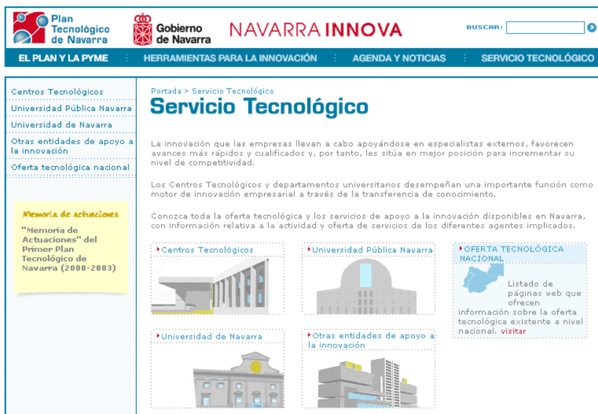
Imagen 7 – Servicio Tecnológico (detalle de la portada)